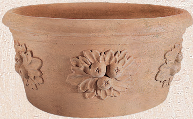
ART. 28 CIOTOLA TULIPANO