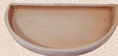
ART. 83 SOTTOVASO SEMICIRCOLARE