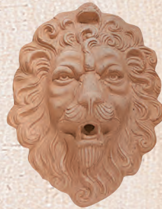
ART. 43 LEONE