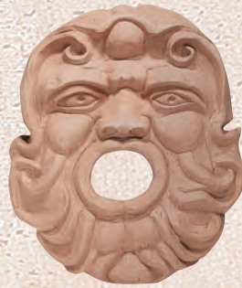
ART. 41 MASCHERONE