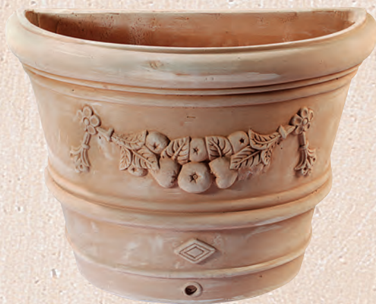
ART. 54 VASO PARETE FESTONATO

cm.L P H KG 57 33 40 15 _____ 72 43 52 30 _____