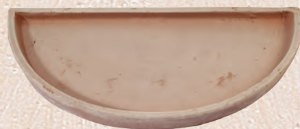
ART. 82 SOTTOVASO SEMICIRCOLARE

cm.L H KG 35x 20 1,5 42x 21 2 50x 25 3,5