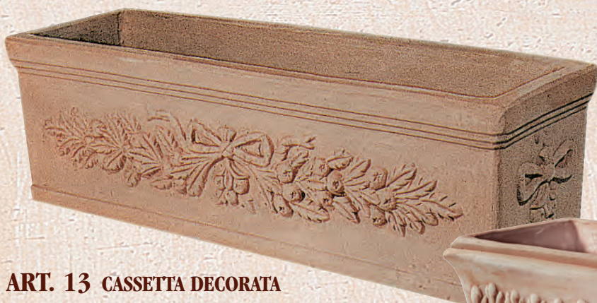
ART. 13 CASSETTA DECORATA