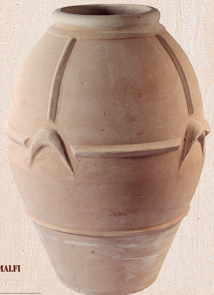
ART. 70 ORCIO AMALFI

cm. Ø H KG 42x 42 13 _____ 50x 50 22 _____ 60x 60 30 _____