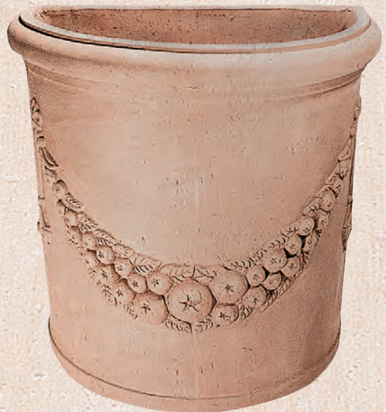
ART. 51 SEMICERCHIO FESTONATO

cm.L P H KG 52 28 28 11 _____ 62 34 34 18 _____