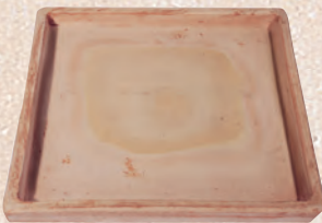
ART. 85 SOTTOVASO QUADRO