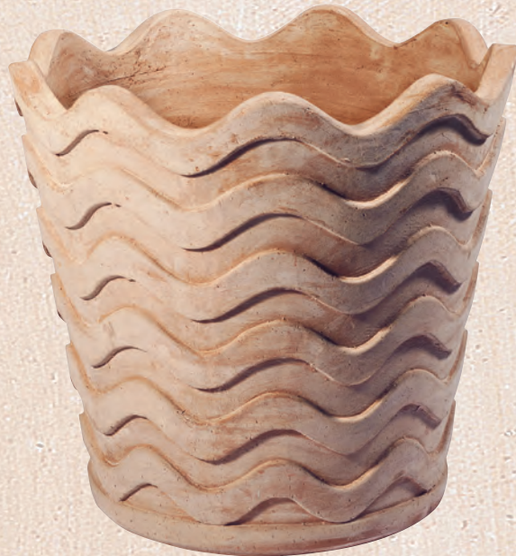
ART. 26 VASO ONDA