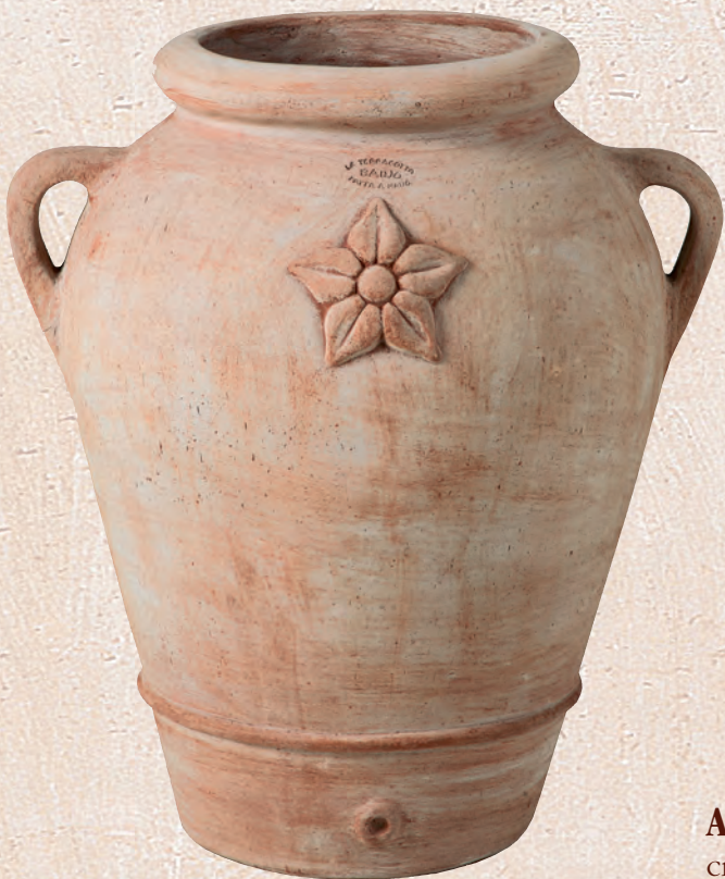
ART. 72 ORCIO VICENZA

cm. Ø H KG 50x 38 13 _____ 60x 45 22 _____ 70x 80 27 _____