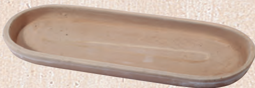
ART. 81 SOTTOVASO OVALE