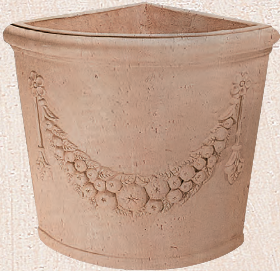
ART. 55 ANGOLO FESTONATO