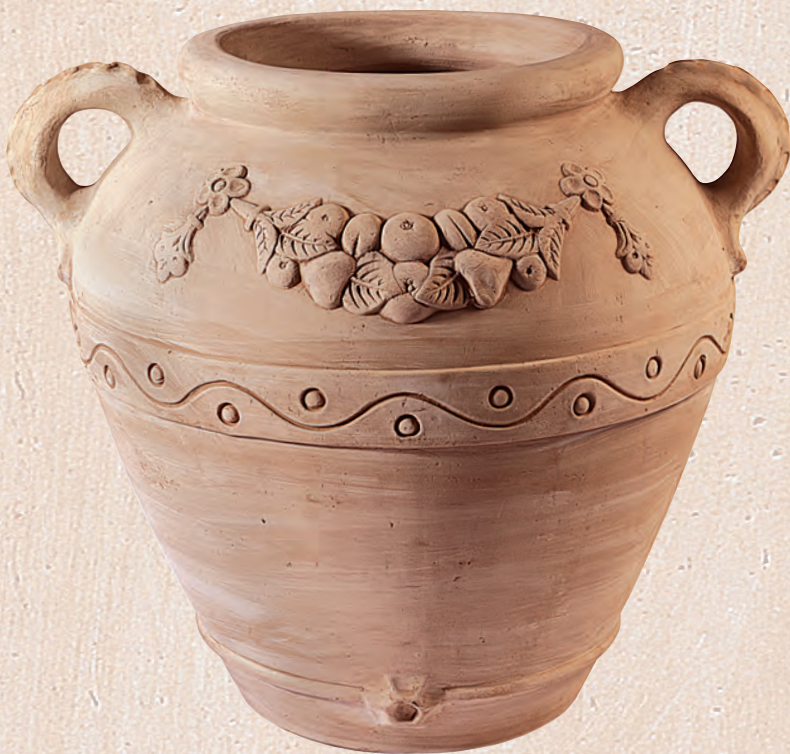
ART. 71 ORCIO VENEZIA

cm. Ø H KG 50x 38 13 _____ 60x 43 20 _____