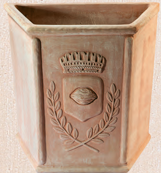
ART. 59 MEZZO ESAGONO STEMMA

cm.L P H KG 57 33 40 15 _____ 72 43 52 30 _____