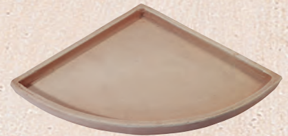
ART. 84 SOTTOVASO ANGOLARE