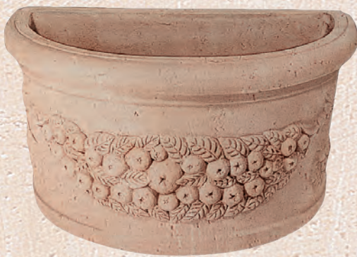
ART. 52 SEMICERCHIO FESTONATO

cm.L P H KG 37 37 32 13 _____ 45 45 37 18 _____