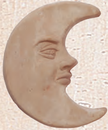
ART. 47 LUNA