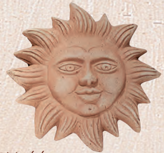
ART. 44 SOLE