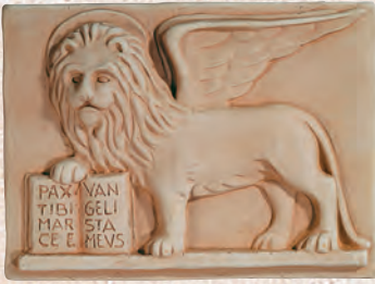
ART. 45 LEONE SAN MARCO