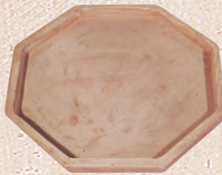
ART. 86 SOTTOVASO OTTAGONALE