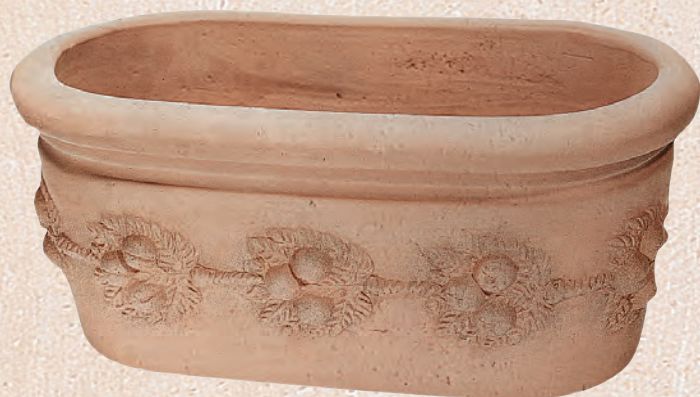
ART. 21 CASSETTA OVALE DECORATA