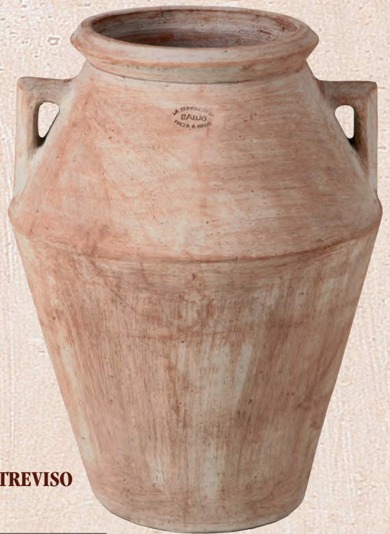
ART. 73 ORCIO TREVISO

cm. Ø H KG 50x 38 13 _____ 60x 45 22 _____ 70x 80 27 _____