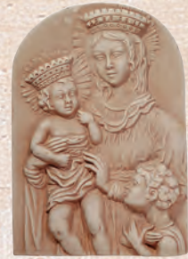
ART. 46 MADONNA