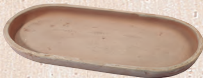
ART. 80 SOTTOVASO OVALE

cm.L H KG 35x 20 1,5 42x 21 2 50x 25 3,5