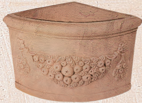
ART. 56 ANGOLO FESTONATO

cm.L P H KG 37 37 32 13 _____ 45 45 37 18 _____